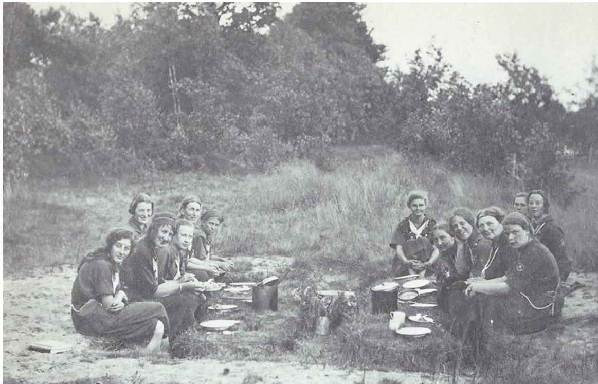
Een historische foto van de eerste zogenaamde A-cursus, die in juli 1923 in Ommen werd gehouden. We zien hier de deelnemers aan het middagmaal.