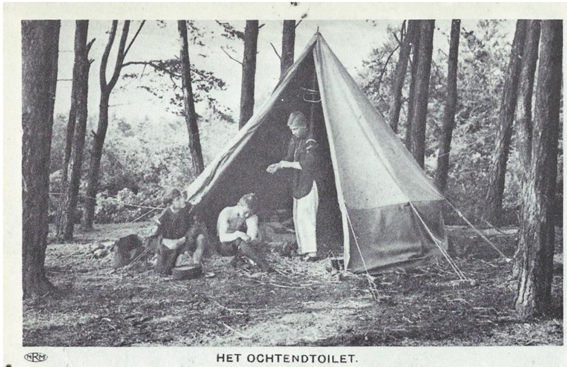
Opname uit de 4 de serie van de "2 de 's-Gravenhaagse (baron Van Pallandt) troep.