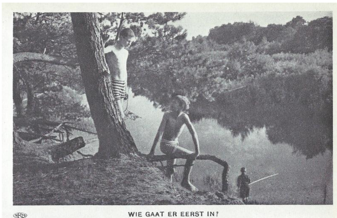
Een historisch beeld: de Steile Oever te Eerde bij Ommen. Wat is een idealere kampplaats dan één met zwem- en viswater direct naast de tent? Hier zien we wederom Haagse scouts in actie in voor die tijd uitermate moderne zwemkleding.