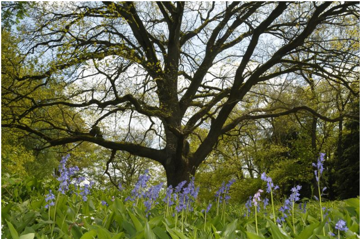
Boswachter Jos Schouten: 'Nog steeds verwonder ik me erover hoe mooi het hier is.'