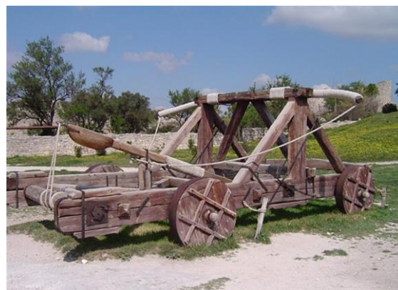
Met blijdes schoten de belegeraars grote stenen tegen de muren van kasteel Eerde.

Onder het voor deze belegering aangevoerde materiaal bevond zich ook een grote partij "donrecruyt" (buskruit), wat door de Deventernaren in Vlaanderen was gekocht. Het slot Eerde viel aldus de "eer" te beurt, als eerste in den lande met dit "donderkruit" te worden beschoten. En men kreeg hier wel een goede gelegenheid dit nieuwe strijdmiddel te "testen". Veel schijnt het echter nog niet te hebben uitgericht. Geen wonder, stenen van 1300 pond, die met een zware blijde tegen de muren van deze veste werden geslingerd, stuitten als kaatsballen af op de "met als molenstenders zo zware balken" in vakwerk gebouwde muren en kwamen deels weer gelijk een boemerang in het kamp der belegeraars terug.