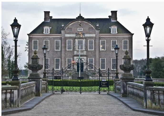
Havezate Eerde, zoals je dat nu kent, werd in 1715 gebouwd. Een havezate was een groot huis waar een adellijke familie woonde.

http://www.regiocanons.nl/overijssel/salland/ommen-in-de-klas/eerde-verwoest-en-Historische-Kring-Ommen )